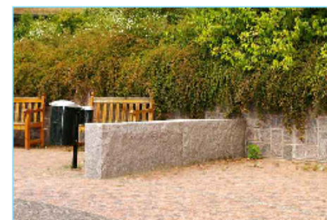
Blocksten granit höjd ca 600mm över mark

Asperö norra Parkering för cyklar och mopeder och golfbil Skiss 230529. BÖ