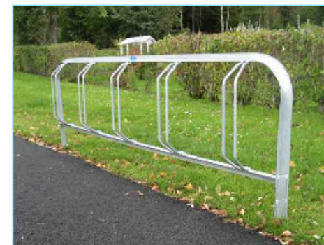
Cykelställ Standard ingjutet