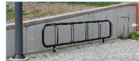
Cykelställ typ Årebro